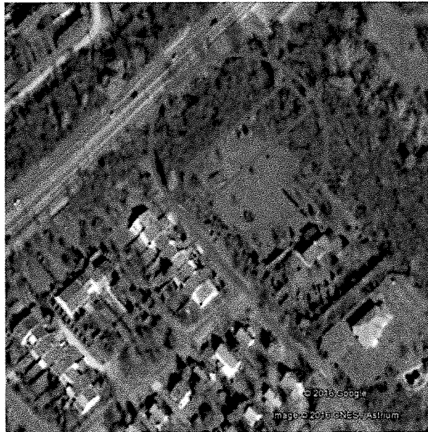
Google Earth nézetén sűrű zöldfelület határolja

A módosításnál figyelembe vett körülmények: