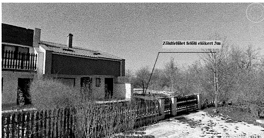
A Katica utcai sorház esetében 3m az előkert a zöldfelületi oldalon