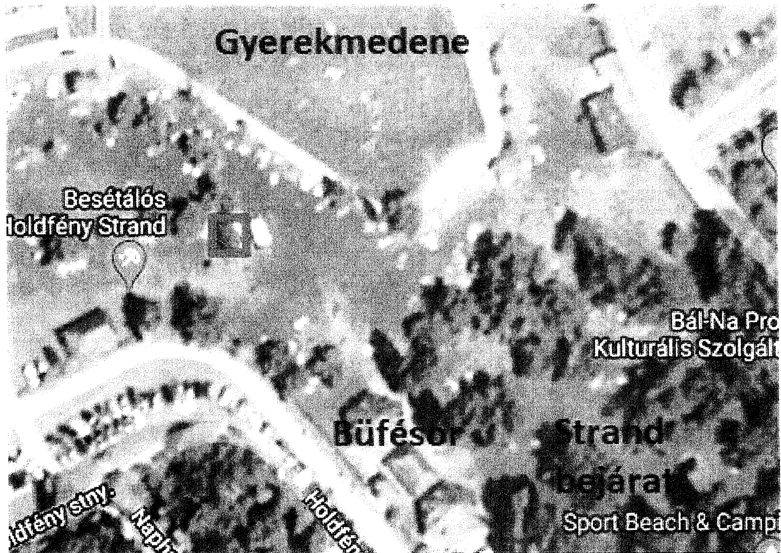
1. sz. melléklet