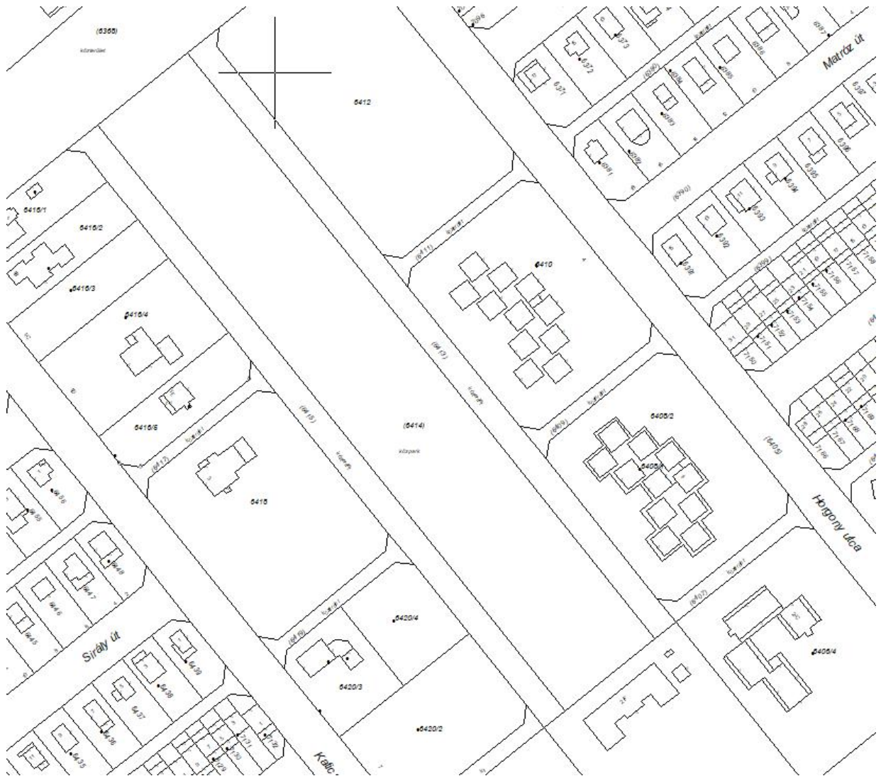
Térkép a területt 1: